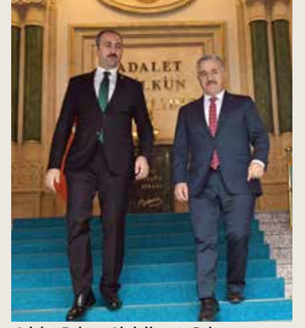
Adalet Bakanı Abdulhamit Gül

Zaman ve akaryakıt tasarrufundan kaynaklı yılda toplam 17 milyar Türk Lirası tasarruf sağlandığına dikkat çeken Arslan, "Ülke genelinde karayolları marifetiyle yaptığımız bütün projelerin yıllık maliyeti 17 milyar. Yaptığımız projelerle öyle bir tasarruf eder noktaya geldik ki, o tasarrufu tekrar yol yapmaya harcıyoruz. 17 milyar tasarruf, 17 milyar her yıl karayollarına para aktarılması demek." dedi. Bakan Arslan, yap-ışlet-devret modeliyle de ekonomiyi büyüttüklerini sözlerine ekleyerek, "Yap-ışlet-devret modeliyle hayata geçirilen projelerin işletme süreleri bittiğinde ülkemize yine ilave gelir gelecek." diyerek sözlerini tamamladı.