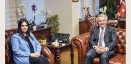
Çalışma ve Sosyal Güvenlik Bakanı Jülide Sarıeroğlu

Ulaştırma Denizcilik ve Haberleşme Bakanı Ahmet Arslan, Başbakan Binali Yıldırım tarafından açıklanan yeni kabinenin ardından 65. Hükümette görev alan yeni bakanları makamlarında ziyaret etti. Bakan Arslan, Adalet Bakanı Abdulhamit Gül, Çalışma ve Sosyal Güvenlik Bakanı Jülide Sarıeroğlu, Çevre ve Şehircilik Bakanı Mehmet Özhaseki, Kültür ve Turizm Bakanı Numan Kurtulmuş ile Gençlik ve Spor Bakanı Osman Aşkın Bak'a yeni görevlerinde başarılar diledi.