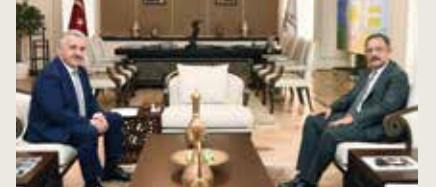
Çevre ve Şehircilik Bakanı Mehmet Özhaseki