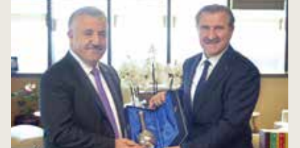
Gençlik ve Spor Bakanı Osman Aşkın Bak