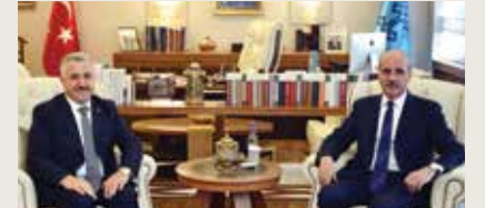
Kültür ve Turizm Bakanı Numan Kurtulmuş